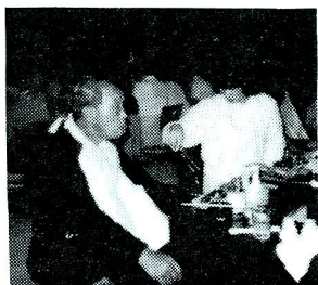
黒茶屋での会長さん