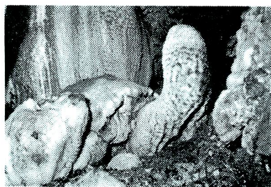
竜宮の亀（三ッ合鐘乳洞）

（吉川英治記念館）文豪吉川英治の疎開先の生活や遺業が残され、この静かな佇まいの中で多くの人々を魅了し続ける、宮本武蔵、新平家物語等多くの作品が生れたと思うと深い感動をおぼえるばかりです。