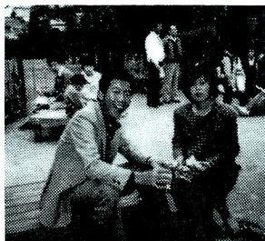
吉川英治記念館にて