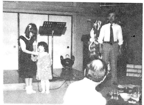
可愛い歩ちゃんの歌

朝、定刻の10時15分大和市役所前を出発、一路新宿末広亭に向い、バスの中では和やかな雰囲気です。予定より早めについた。本日はNETの録画取りがあり予定は2月14日と21日分でした。