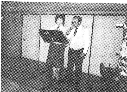
仲睦まじい藤田夫妻