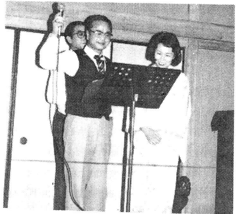
スマイル委員長のサービス