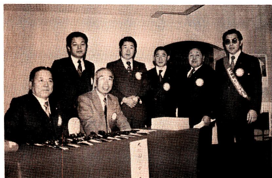
来賓受付の 田園RCのメンバー