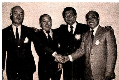
次期も仲よく（4RCの副幹事）