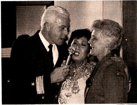
クリスマスソング… 司令官夫婦 と茅さん