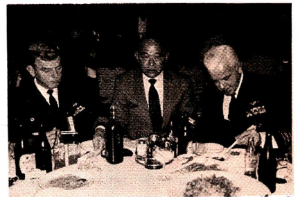
チョプスティックでの食事